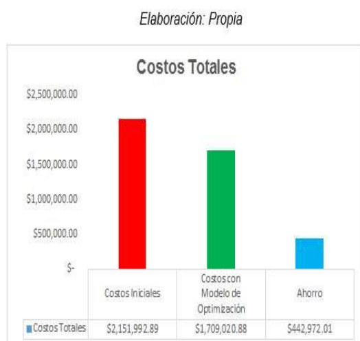
FIGURA 3.4 COMPARATIVO COSTOS TOTALES - AHORRO

comparar los costos totales iniciales vs los costos totales con el modelo de optimización.